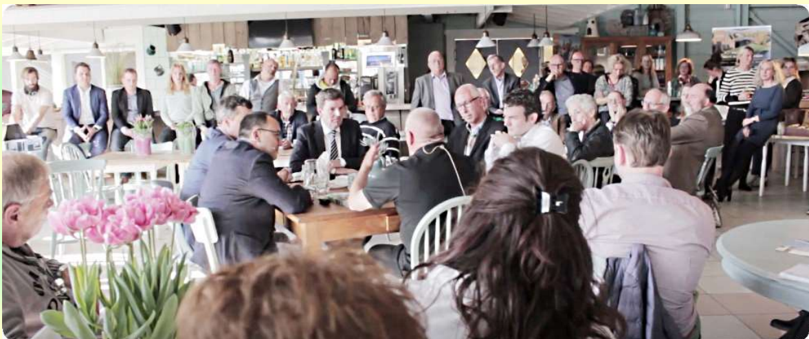
Afb. 10. Aftrap van het VVV seizoen 2017 in Camping Tempelhof te Callantssoog op 27 maart 2017

Ter ondersteuning van deze informatievoorziening gebruiken we de computer, inzetbaar gemaakt met Windows 10. Via internet kunnen we daarmee zo nodig informatie opvragen die op andere wijze niet beschikbaar is. Ook doet de aangeschafte telefoon zo nodig goede diensten.