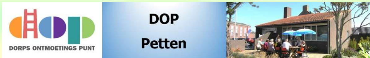
Afb. 4. Bovenbalk website www.doppetten.nl

Vanaf augustus 2015 is onze website www.doppetten.nl actief.