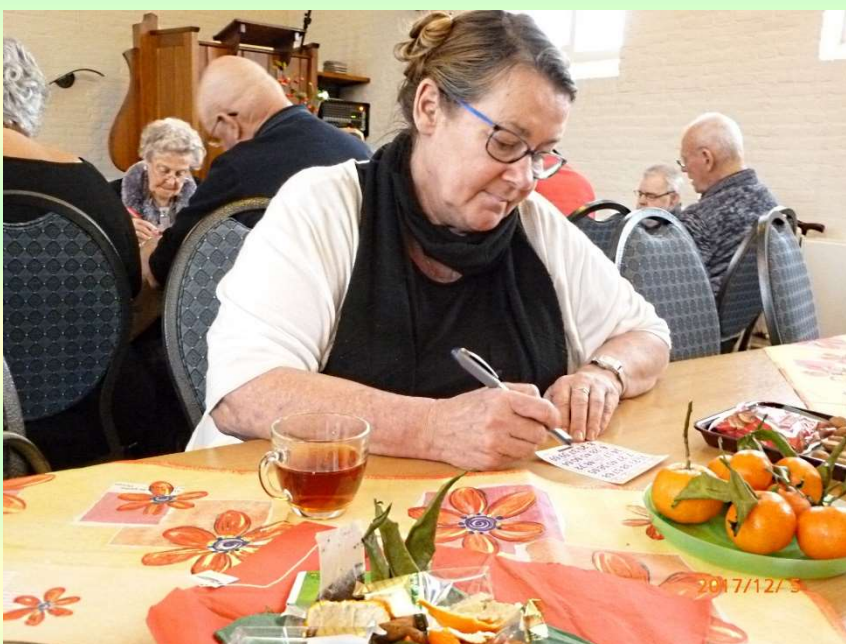
Afb. 13. Na afloop van het bezoek van Sinterklaas werd een bingospel gespeeld.