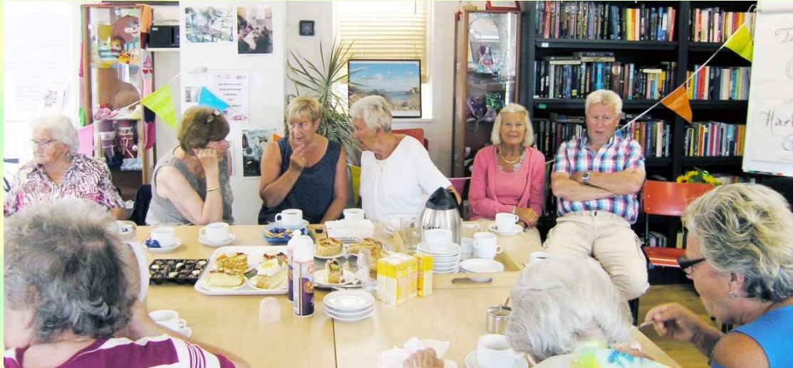
Afb. 15. DOP-bijeenkomst 7 juli 2017