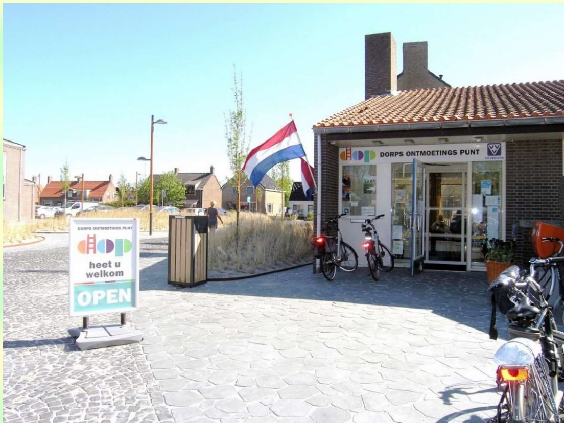
Afb. 17. Het huidige DOP onderkomen met nieuwe bestrating