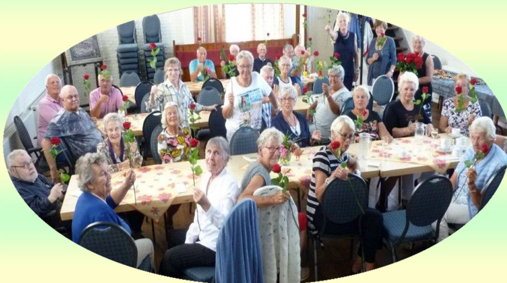
Afb. 7. Brunch in de kerk 13 augustus 2017