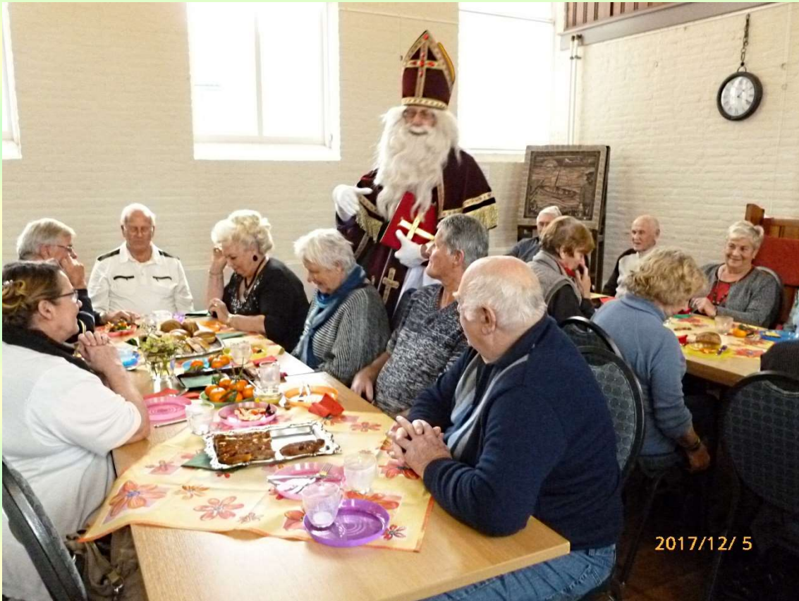
Afb. 12. Bezoek Sinterklaas aan het DOP 5 december 2017

Het werd al met al een erg geslaagde bijeenkomst.