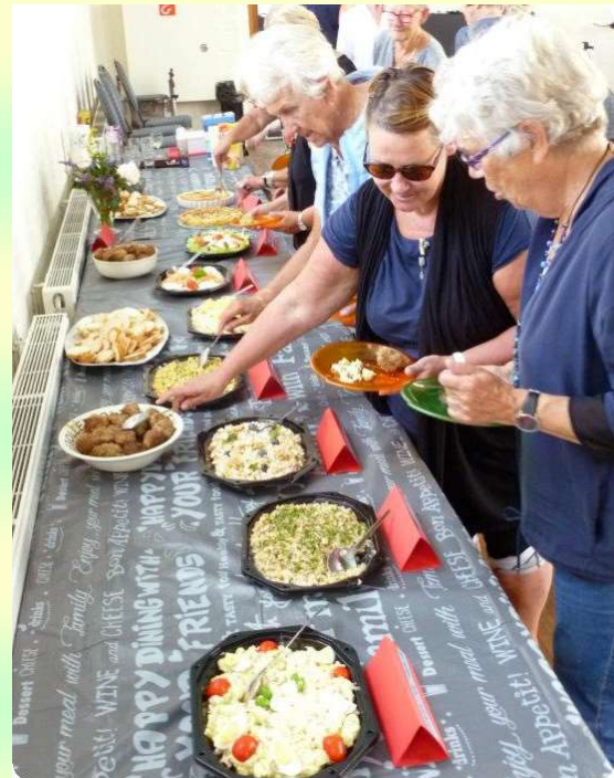
Afb. 9. Het aanbod zelf gemaakte schotels was overweldigend