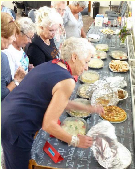
Afb. 8. Moeilijk uit aanbod te kiezen brunch 13 augustus 2017 in de kerk

Door de geleidelijk aan grotere toeloop van bezoekers is de wens geuit te bekijken of uitbreiding van het DOP-gebouw mogelijk is. Begin volgend jaar zal worden nagegaan of en zo ja welke mogelijkheden tot uitbreiding voorhanden zijn.