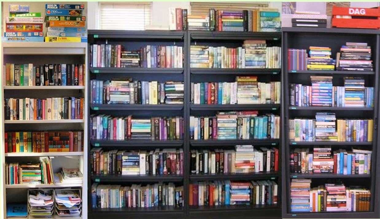
Afb. 2. Boekenkasten in het DOP