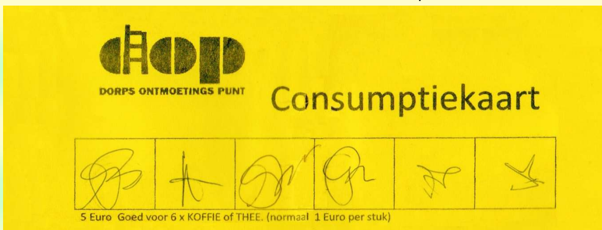
Afb. 19. Consumptiekaart DOP, goed voor zes consumpties

Inkomstenbron is de uitgifte van consumptiekaarten. Eén kopje kost € 1,-. Een consumptiekaart kost € 5, - en is goed voor 6 kopjes koffie of thee. Hiermee worden koffie en thee met toebehoren ingekocht. Daarnaast worden meest kleinere bedragen aan sponsorgelden ontvangen. Deze gelden worden gebruikt voor aanschaf van eenmalige gebruiksartikelen voor speciale bijeenkomsten. De toename van het aantal bezoekers beïnvloedt het kassaldo positief.