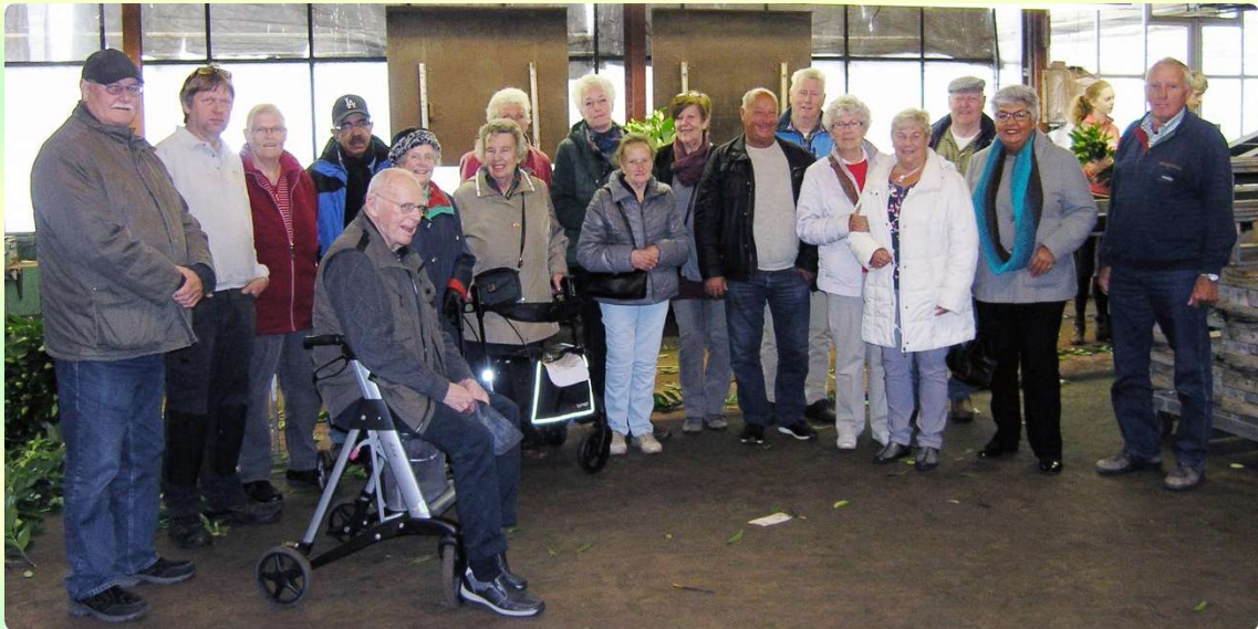
Afb.14. Bezoekers DOP aan Leliekwekerij Entius Heerhugowaard donderdag 4 mei 2017