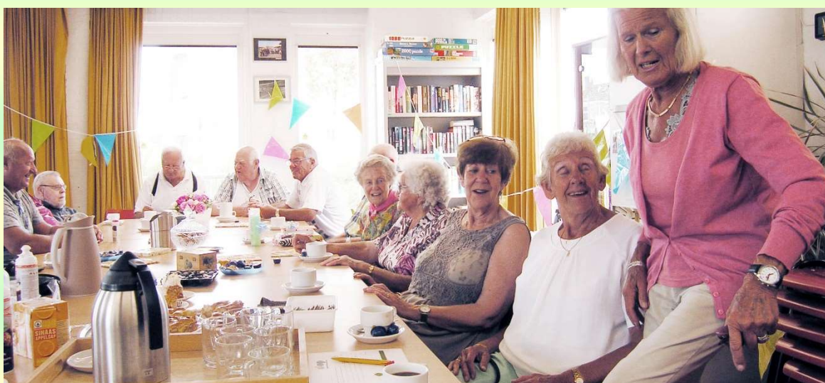
Afb. 20. Volle bak in het DOP juli 2017

In juni hebben we een subsidieverzoek voor het jaar 2018 ingediend. Deze kon vanwege toegenomen inkomsten van consumptiebonnen tot € 2.200, - worden beperkt. Eind december ontvingen we bericht dat de subsidie voor 2018 ook is toegekend.