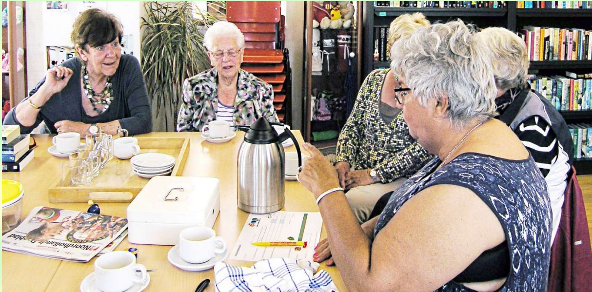
Afb. 1. Bijeenkomst Dorps Ontmoetings Punt Petten 15 mei 2017

Daarnaast hebben we weer enkele themamiddagen georganiseerd, zie daarvoor hoofdstuk 7.